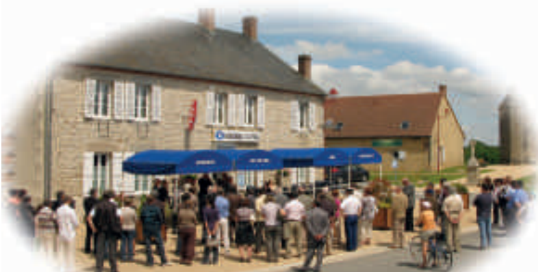
Le Fond pour la Revitalisation de l'Economie Rurale Locale, association du Crédit Agricole Centre France, accompagne des initiatives comme l'installation de multiservices. Ici à Saint-Fiel, en Creuse, 917 habitants.

Très présent grâce à ses implantations, le Crédit Agricole Centre France l'est aussi par l'utilisation de certains de ses budgets. Tout au long de l'année, il sponsorise des manifestations organisées par des petits clubs locaux comme par de plus grands.