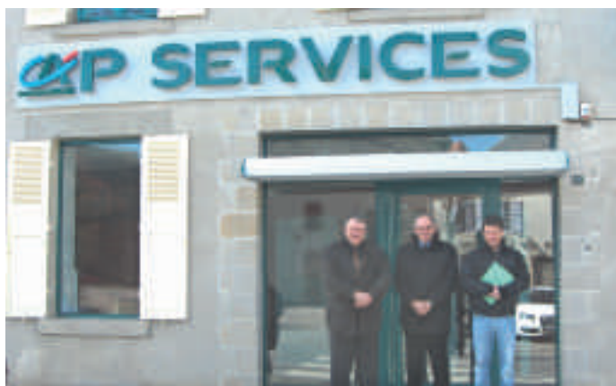
Le Crédit Agricole Centre France met ses locaux à disposition des services publics à Jarnages (Creuse).

Un partenariat public-privé cela ne court pas les rues. Et pourtant. Toujours pour maintenir une présence en milieu rural, le Crédit Agricole Centre France a signé en 2007 un partenariat avec l'Etat . Par cette convention de coopération, l'agence Libre-Service Bancaire du Crédit Agricole de Jarnages devient CAP Services . Ses bureaux sont mis à la disposition des services publics comme les services fiscaux, la CAF, la DDA, la DDE, la Direction du Travail ou encore la MSA. Les associations locales utilisent également ces locaux mis à leur disposition, c'est ce que font l'AGARDOM et l'AFORMAC (associations d'aide à domicile et de formation).